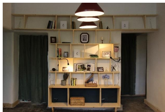
3. Expoziția Cutia cu fotografii, instalată în biblioteca din Ogoi

Vizitatorului i se propune, astfel, o descoperire personală, experiențială a oamenilor ce au construit locul și comunitatea în care se află acesta. Prin deschiderea cutiei și răsfoirea fotografiilor, acestuia i se deschide universul satului mehedintean, în care este inițiat prin micile ferestre către trecut. Presentul se află în afara Ogoiului, iar trecutul în interiorul acestuia.