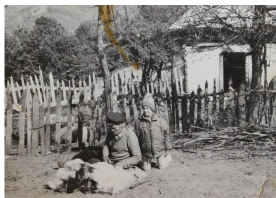
6. Tunsul oilor, 1985 – Ponoarele.