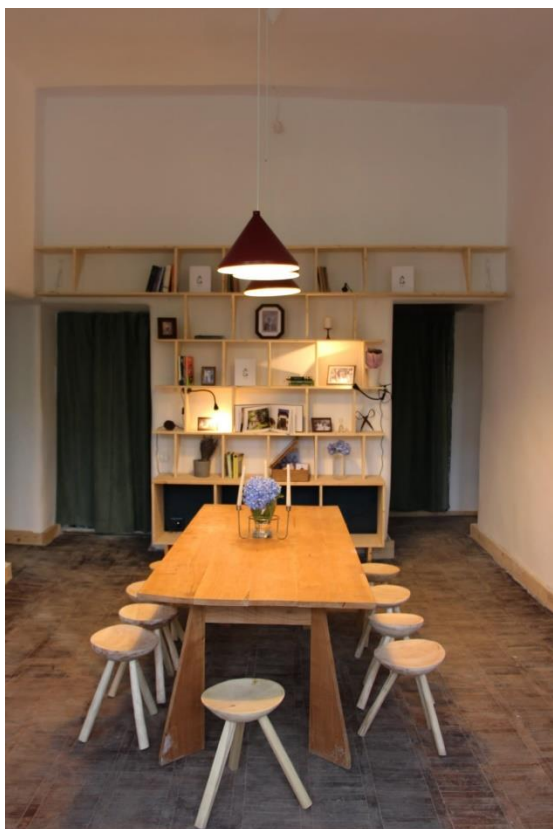
1. Biblioteca din Ogoi care găzduiește expoziția Cutia cu fotografii

Cercetarea antropologică de teren s-a finalizat prin organizarea unei expoziții găzduite de casa Ogoi. Acest spațiu este fosta primărie a comunei Balta, aflat acum în grija Asociației MAIE. Echipa de proiect dorește reconversia acestui spațiu, oferindu-i o nouă utilitate și reintegrându-l în comunitate.