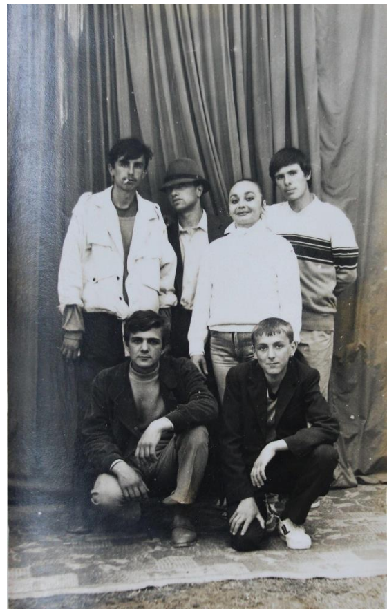
18. Sărbătoarea Liliacului în anul 1991

Peisajul natural era de multe ori ascuns în spatele unor panouri pictate, ce descriau locuri îndepărtate și pitorești, în fața cărora oamenii erau încântați să fie immortalizați.