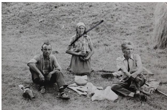
4. Fotografie realizată de un turist neamț, aflată acum în arhiva de fotografii a familiei Tudora

Fotografia ca hobby a permis imortalizarea unor momente din viața domestică de zi cu zi, precum tăierea porcului, muncile câmpului sau instantanee fără o ocazie specifică. Astfel, fotografia devine o reflexie a mediului personal, dar este și o parte integrantă a culturii unei comunități. Fotografii amatori puteau surprinde cadre mult mai intime, din sfera vieții private, permițându-ne astfel să observăm cadre care până la acel moment nu au avut ocazia să fie surprinse pe film.