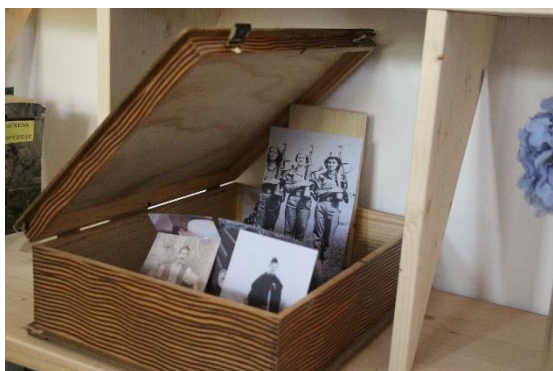
2. Cutia cu fotografii din Ogoi

Conceptul expozițional reflectă tendințele din noua muzeologie, adaptându-se la spațiul Ogoiului. Acesta este o casă a comunității. Așa cum localnicii ne-au primit în locuințele lor și ne-au arătat fotografiile ce vorbeau despre istoria lor personală, la fel vizitatorii găsesc pe rafturile bibliotecii o cutie cu fotografiile ce oglindesc o istorie locală. Micro-istoriile membrilor comunității devin, astfel, macro-istorie. Prin acest concept, ne-am dorit ca vizitatorul Ogoiului să aibă parte de o experiență asemănătoare cu ce avută de noi în timpul cercetării. Astfel, întreaga expoziție este cuprinsă într-o cutie, asemănătoare cu cea pe care localnicii o folosesc pentru stocarea arhivelor personale de fotografie.